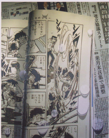
「あしたのジョーに水滴」F100号 (162cm×130cm)