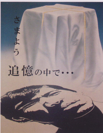
「さまよう追憶の中で…」F50号 (116cm×91cm)