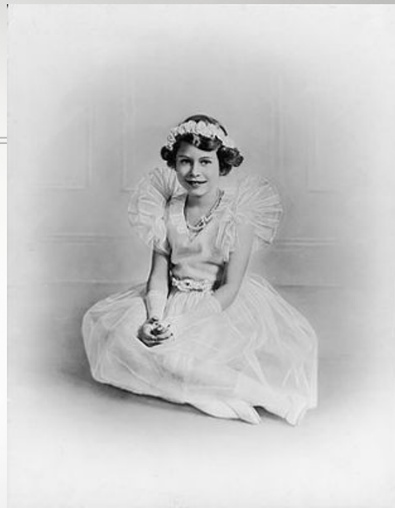
図: エリザベス二世