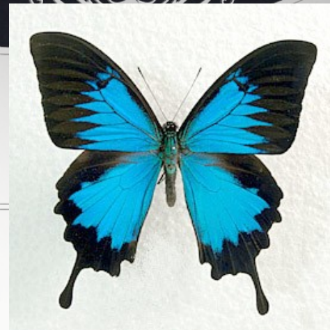
図3:メネラウスモルフォ