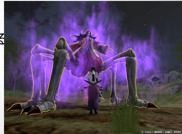
図: ブレイドクロニクルの女郎蜘蛛