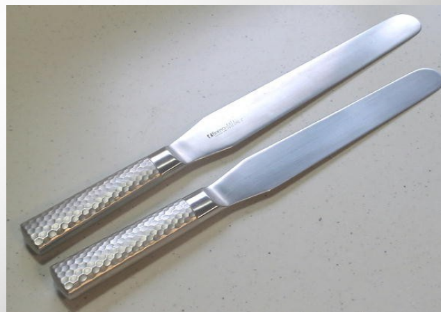
図2: パレットナイフ