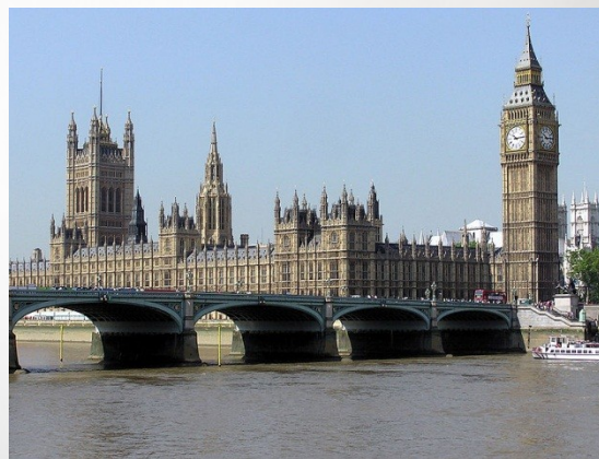
図5: ウェストミンスター寺院