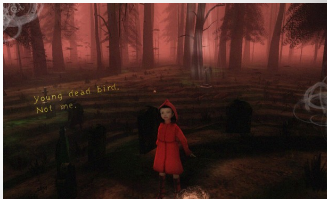
図: ゲーム「the path」