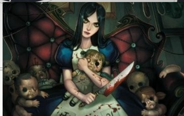
図1: アリスマッドネス