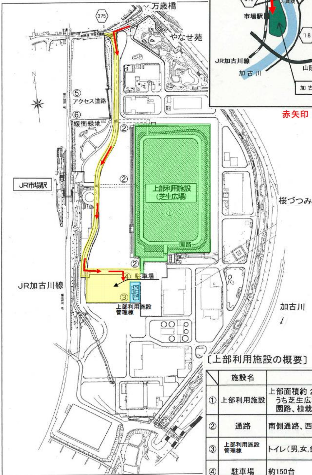
【上部利用施設の概要】