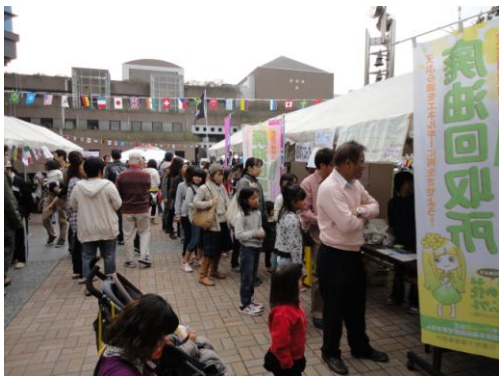
11月7日 松原ワールドフェスタ