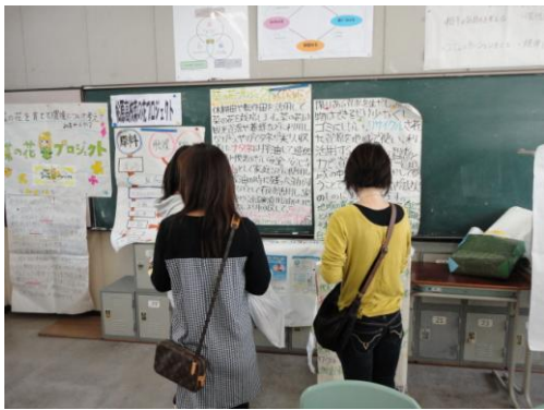
10月24日25日 松原高校文化祭