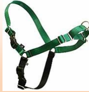
イージーウォークハーネス