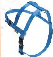
ショルダーハーネス