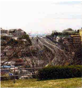
(11)環状2号線 笹下5・2付近、 前方に海が見る