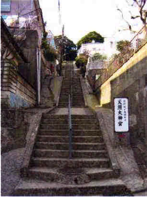
(6)天照大神の参道 ア. 笹下4・9より 参道を見上げる