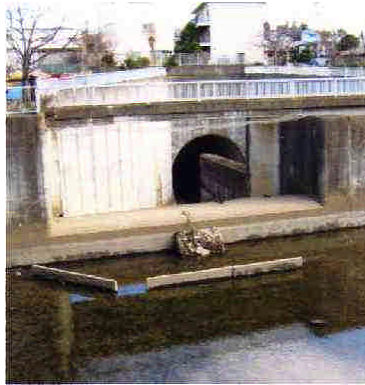
(9)大岡川分水路 分水路は日野川から さらに磯子へ