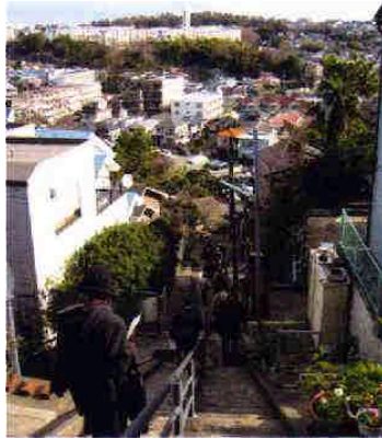
イ. 石段を登り振返 ったところ