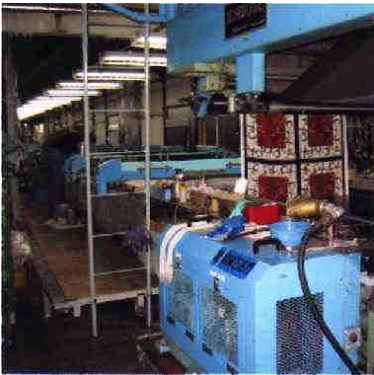
(8)笹下川捺染工場 (株)翔彩の工場を見学 プリントされた布地