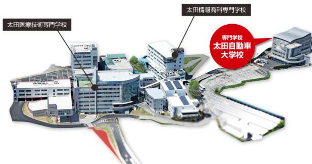
アカデミー全体図