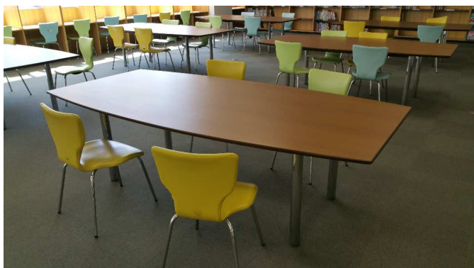
大型机①及び椅子（第2会場9ブース）