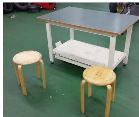
移動机及び椅子（第1、3会場）