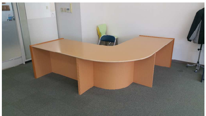
大型机②及び椅子（第2会場1ブース）