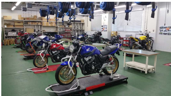
第1会場（二輪実習場）