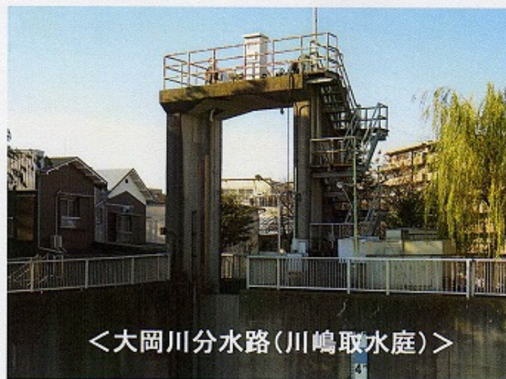
<大岡川分水路(川嶋取水庭)>